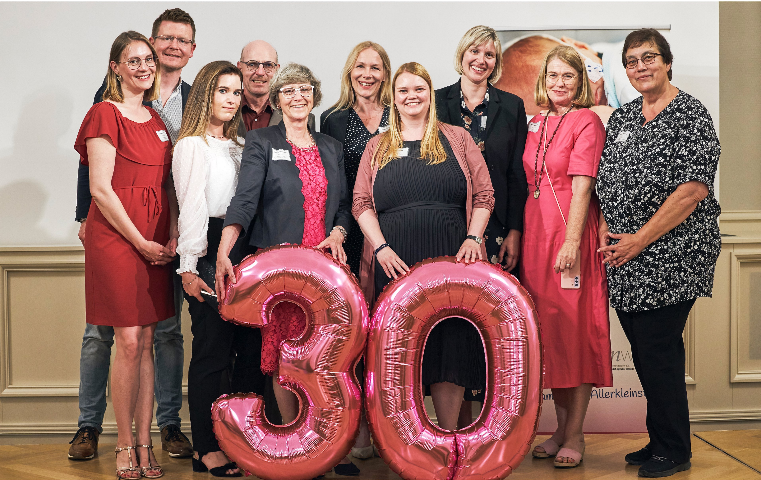
Vorstand des Bundesverbandes und FIZ-Team aus der Frankfurter Geschäftsstelle